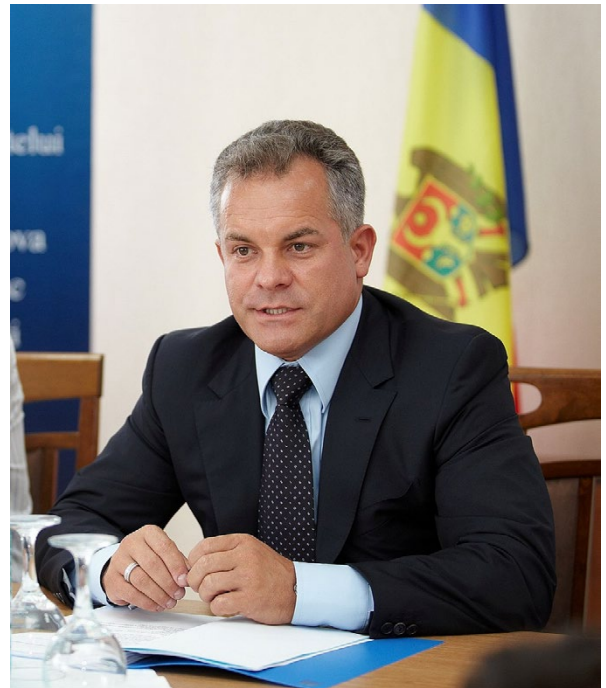
1 pav. Vladimiras Plahotniucas

Nors Moldovos įstatymai teoriškai garantuoja visuomenės informavimo priemonių laisvę, tačiau juos taikant praktikoje kyla iššūkių. Valstybinės institucijos neturi pakankamų įgaliojimų efektyviai prižiūrėti šių teisinių nuostatų įgyvendinimą, tam trūksta ir finansinių išteklių. Pavyzdžiui, Konkurencijos apsaugos įstatymas nėra veiksmingas. Nors numatoma, kad transliavimo licencijos turi būti išduodamos pagal pliuralizmo užtikrinimo principą ir užkertant kelią monopolijai, tačiau, „Freedom House“ duomenimis, sąžininga visuomenės informavimo priemonių konkurencija nėra sėkmingai užtikrinama, o politikai ir kitos interesų grupės randa būdų tiesiogiai ar per atstovus valdyti didelę dalį visuomenės informavimo priemonių 2 .